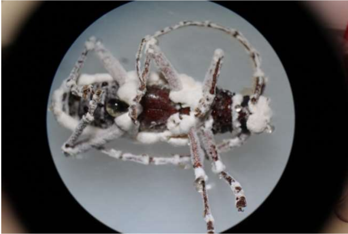
Insecto parasitado con hongos entomopatógenos.

Considerando esta realidad, los especialistas creen que las evaluaciones de la efectividad de los controladores no deben realizarse a corto plazo y es necesario darles un tiempo para que puedan funcionar.