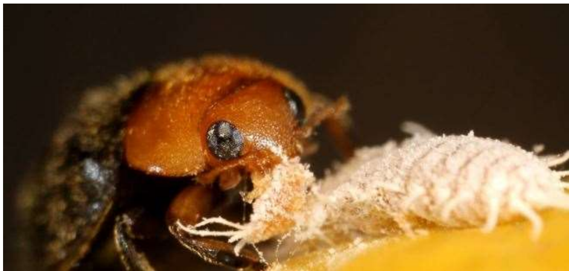
Cryptolaemus montrouzieri depredando al chanchito blanco.

Y el fenómeno está llegando también a las grandes transnacionales de agroquímicos que suman este tipo de controladores a su oferta.