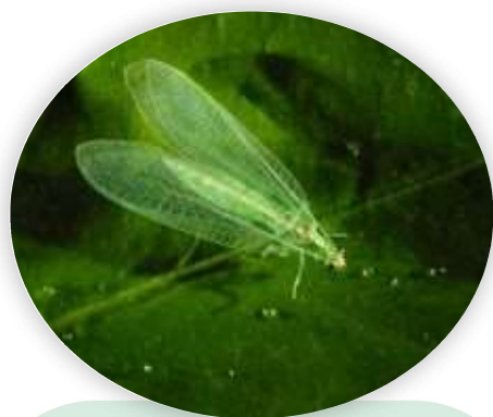
Ejemplar de Chrysoperla (crisopa verde)