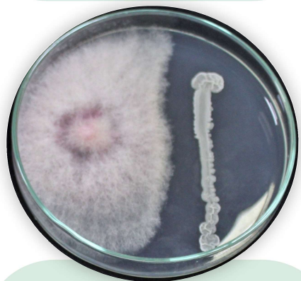
Bacillus sp. controlando a Fusarium