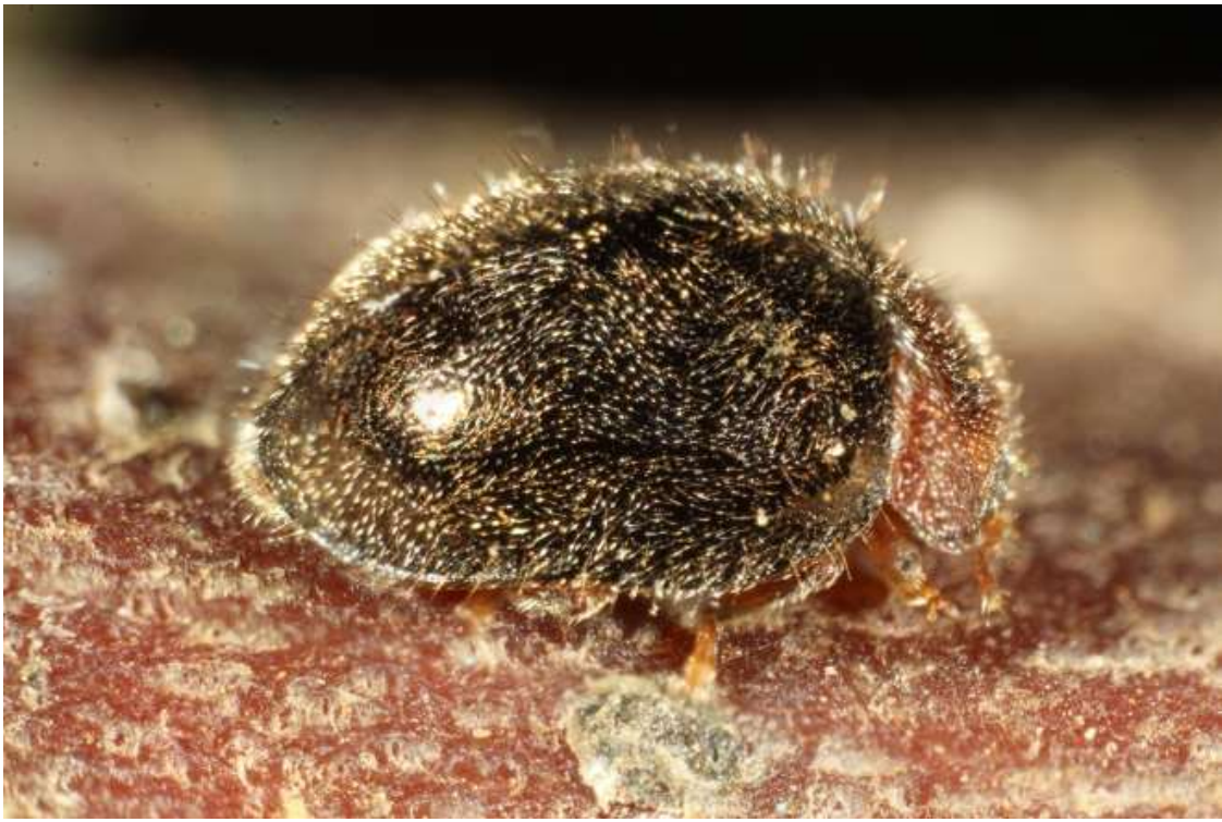
Depredador de escamas púrpura ( Rhyzobius lophanthae ) controlando a la Escama San José ( Diaspidiotus perniciosus ) en cerezo.

Por su parte, INIA, a través de su Centro Tecnológico de Control Biológico (CTCB),