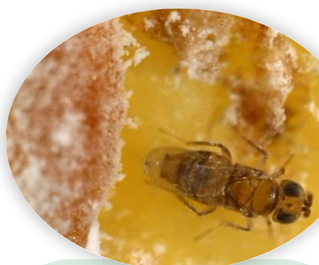
Ejemplar de Acerophagus , controlador del chanchito de la vid